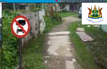
PEMASANGAN PAPAN TANDA