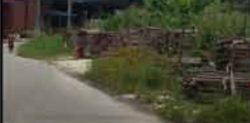
KERJA-KERJA PENYUSUNAN SEMULA PALET