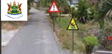
PEMASANGAN PAPAN TANDA